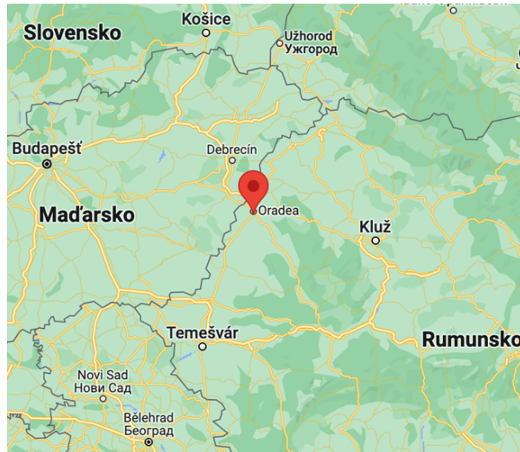
Obrázek č. 1: Mapa umístění města Oradea